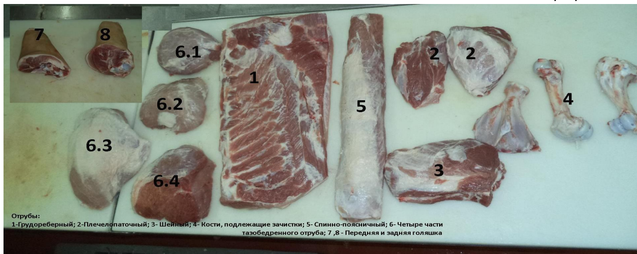
Фотография № 2

бескостные: - четыре части тазобедренного отруба (фотография № 2, изображение 6.1, 6.2, 6.3, 6.4.);