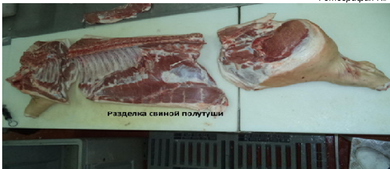
Фотография № 1

Разделку свинины участники Конкурса проводят в соответствии с требованиями ГОСТ 31778-2012 «Мясо. Разделка свинины на отрубы. Технические условия». Порядок выделения отрубов обвальщик определяет самостоятельно. Свиная полутуша разделяется на отрубы (фотография № 1) без предварительного съема шкуры и шпика.